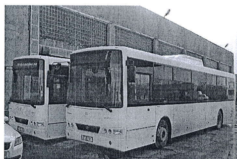
Autobuz Volvo Alfa Localo