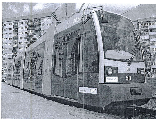
Siemens - ULF la cap linie Nufărul

OTL SA are în administrare o rețea de linii de tramvai cu lungimea totală de 38,891 km cale simplă, care formează un inel în jurul zonei centrale a orașului și trei linii radiale prin care se asigură legătura cu zonele industriale și marile cartiere rezidențiale.