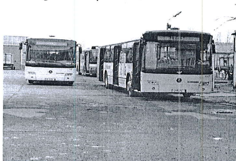
Autobuz Mercedes Connecto

În anul 2015 autobuzele au executat un parcurs de 4.065,2 mii km din care 3.071 mii km pe traseele urbane curse regulate și pe traseele care au înlocuit tramvaiele, 732,9 mii km pe trasee metropolitane + RO-HU și 197,2 mii km pe trasee curse regulate speciale.