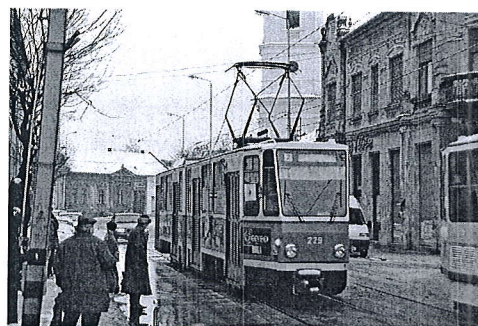
Tramvai TATRA tip KT4D